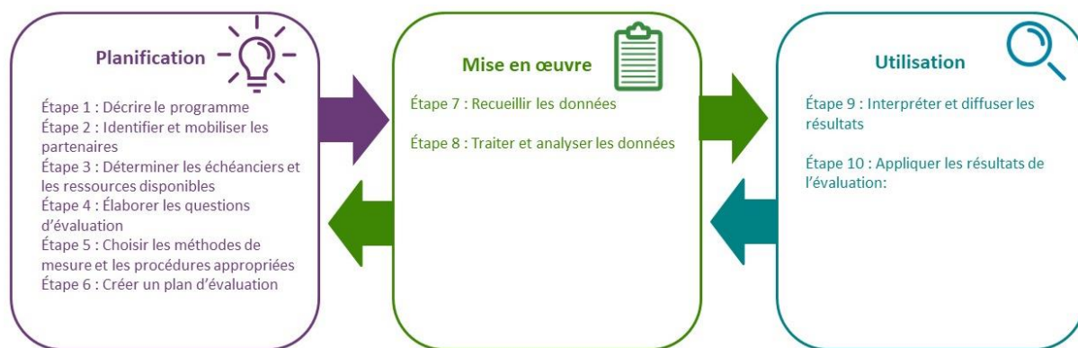
Figure 1 : Dix étapes de l'évaluation fondée sur les objectifs pour les programmes de promotion de la santé

L'évaluation fondée sur les objectifs se compose de dix étapes réparties en trois stades : la planification, la mise en œuvre et l'utilisation. Bien qu'il soit présenté comme un processus linéaire, le modèle peut être plus circulaire ou itératif dans la réalité. Il peut être nécessaire de revenir aux étapes antérieures à mesure de l'évolution de l'évaluation, du programme ainsi que du contexte dans lequel ils s'inscrivent.